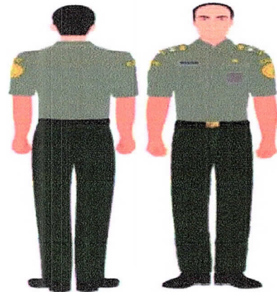
PDH Lengan Pendek Gambar 1.b