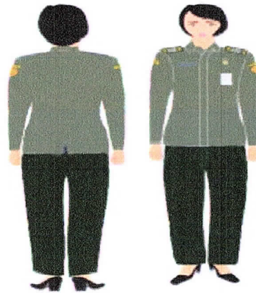
PDH Perempuan Celana Gambar 2.b