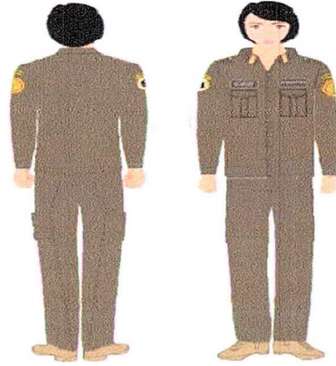
PDL Perempuan Gambar 3.b