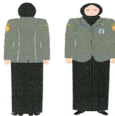
PDH Perempuan Berhijab Gambar 2.d