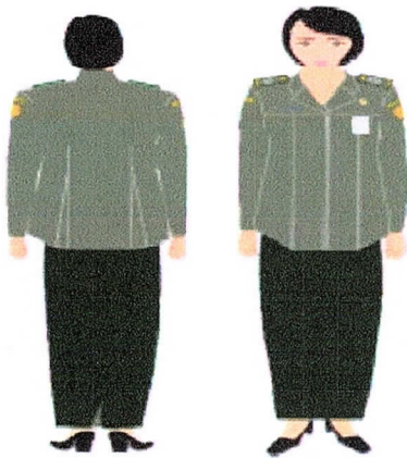
PDH Perempuan Hamil Gambar 2.c