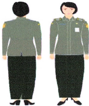
PDH Perempuan Gambar 2.a